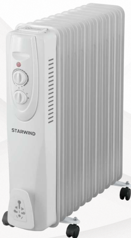
Радиатор масляный SHV3120